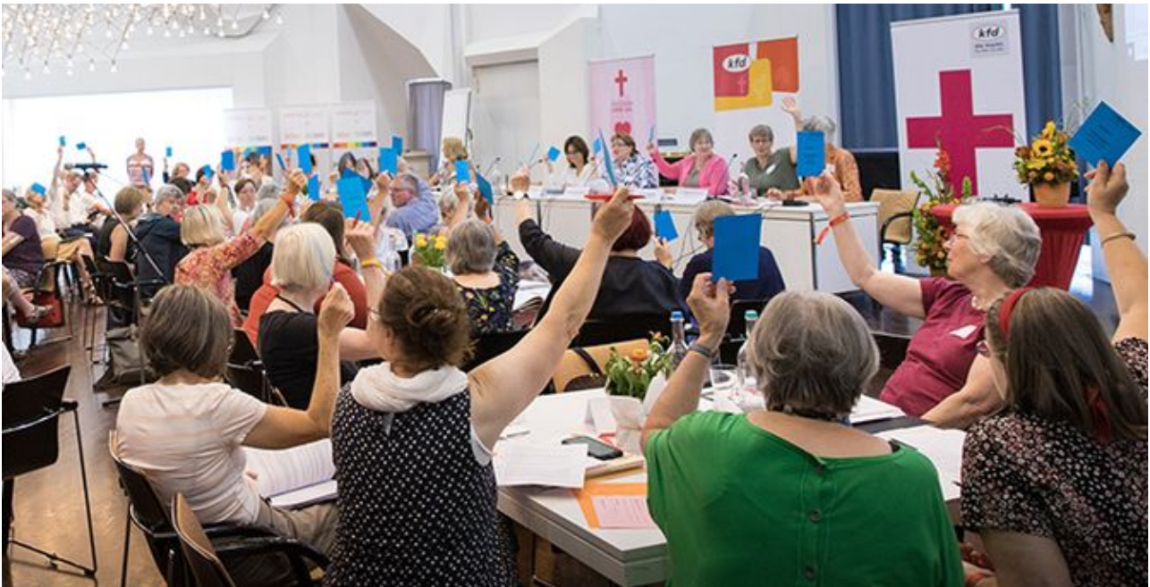
Wir reden mit und positionieren uns. Abstimmung während der Bundesversammlung 2022.